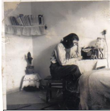
אני במיתנו בכפר עציון