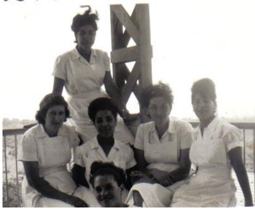
הצוות באירוע פתיחת בית המרפא, אני יושבת משמאל.

ביום הפתיחה התרגשנו מאוד, כל הצוות לבש לבן וקיבל את פני האורחים. כל אורח התקבל בכוס תה. סוכר לא היה בתקופה הזאת בגלל הצנע וכתחליף קיבל כל אחד סוכרייה חמוצה. כשאחד האורחים ביקש ממני חלב, נאלצתי לעטוף את כוס החלב במפית כדי שיתר האורחים לא יראו את החלב ויבקשו גם הם. העבודה הייתה לא פשוטה, אף פעם לא יכולתי להתפנות לאכול בלילות שבת עם בני משפחתי. עבדתי שתיים עשרה שעות רצופות. חזרתי הביתה לבד בשעות הקטנות של הלילה. כשאחד מילדי היה חולה לא יכולתי להתפנות לטפל בו והמשק מינה אחת מהחברות לטפל בו במקומי. גם חופשות לידה לא קיבלתי כמקובל במשק, לא ויתרו עלי. כנראה שהייתי עובדת חיונית ובצעתי את תפקידי לא רע. מלאכת ניהול חדר האוכל הייתה מלאכת מחשבת ממש. הייתי צריכה להתאים מי ישב עם מי. אנשים לא הגיעו לבית המרגוע רק בכדי לנפוש פיזית הם חיפשו אוירה נעימה ומי שישמע את תולדות חייהם, ישאל בשלומם וישמור איתם על קשר. היה לי מאוד חשוב שאנשים ייהנו בבית המרגוע וישובו אליו בשנית, זאת הרי הייתה עיקר הפרנסה של ניר עציון במשך שנים. האורחים היו איתי בקשר טוב כל השנים, הם הכירו לי טובה ובאו לבקר אותי. התקופה הנעימה ביותר בחיי הייתה כשהיו "ירחי כלה" בבית המרגוע. הגיעו לכאן רבנים גדולים ותלמידי חכמים. היו שיחות מדהימות והייתה אוירה של קדושה. מאד נהניתי מעבודה הזאת בה עבדתי שנים. יש לי קשר טוב עד עצם היום הזה עם המלצרים שעבדו איתי בבית המרגוע. בכל מקום שאני מגיעה אליו אני מוצאת מכרים ומכרות מתקופת עבודתי בבית המרגוע.