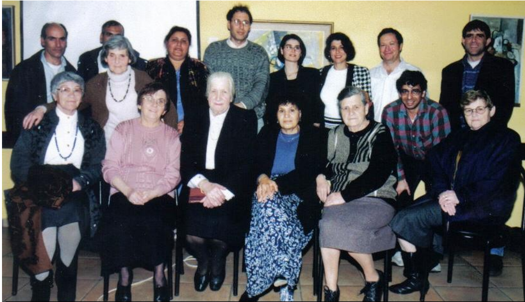
צט צוקדי בית המראצ במסיבת ההתצה לראל סיוט אבודתי .