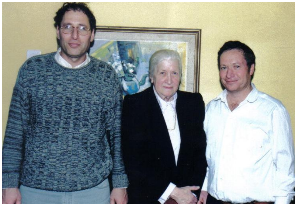
צט יורט ויואל מנהלי בית הארחה במסיבה לכבודי