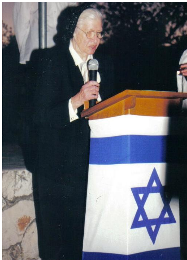
אני נושא דברי ברכיה בחגיגת החמישים,