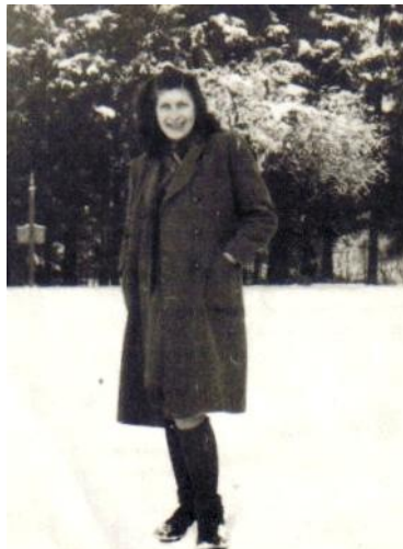
אני במחנה חורף בהרי הטטריס. הלובן בקצ, cfe.