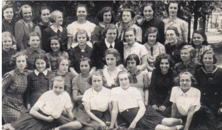
הכיתה שלי בבית הספר התיכון הס'3'ומ'3ה. אני עליית אימין בעורה השנייה.

סדר היום שלנו התחיל מוקדם בבקר את המיטות לא אנחנו סידרנו זאת הייתה עבודה קשה כי המזרנים היו עשויים מקש והיה מאד קשה להזיז אותם.