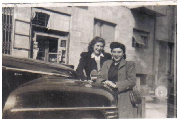
חברתי ואני בירושלים הנצורה