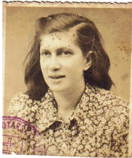
אני כנוצריה בדרכון ההולנדי